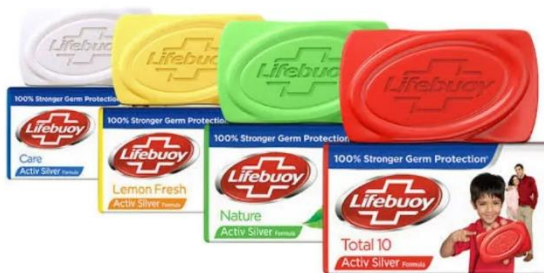
Gambar 2.2 Sabun Batangan Lifebuoy Varian Activ Silver