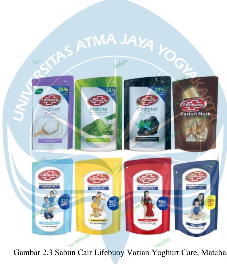
Gambar 2.3 Sabun Cair Lifebuoy Varian Yoghurt Care, Matcha, Charcoal, Katsuri Musk