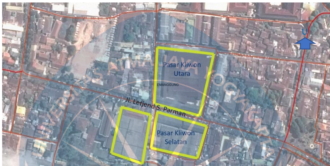
Gambar 1. 2 Lokasi Pasar Kliwon Temanggung

Lokasi penelitian pada Pasar Kliwon Temanggung, Kabupaten Temanggung, Jawa Tengah yang dapat dilihat pada Gambar 1.2.