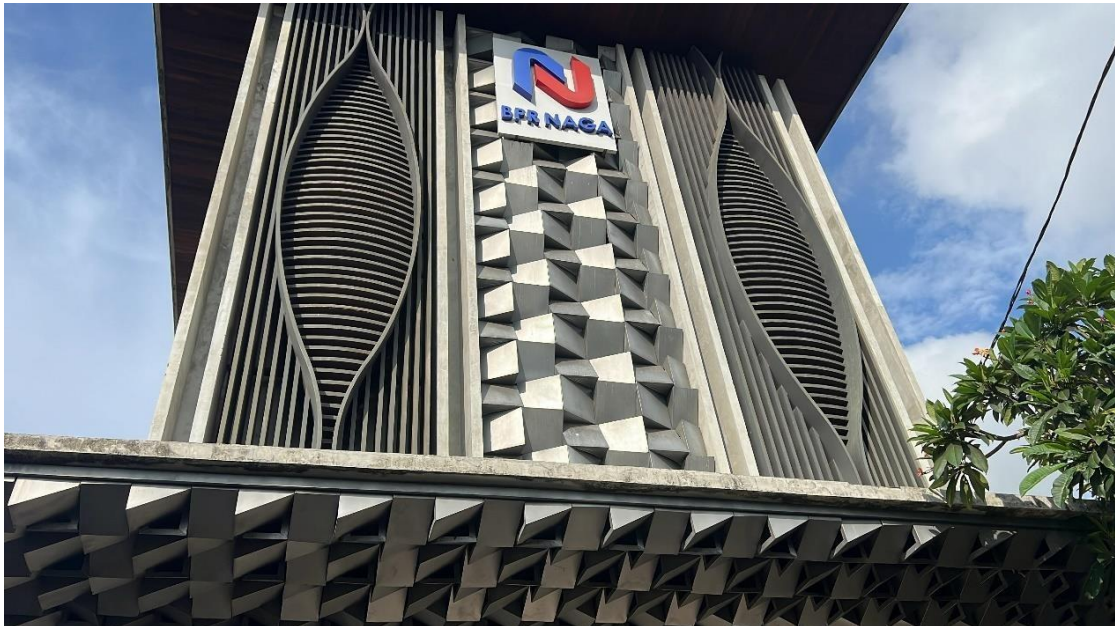
Sumber gambar 1.2 Tampak depan kantor PT BPR NAGA saat penulis melakukan penelitian