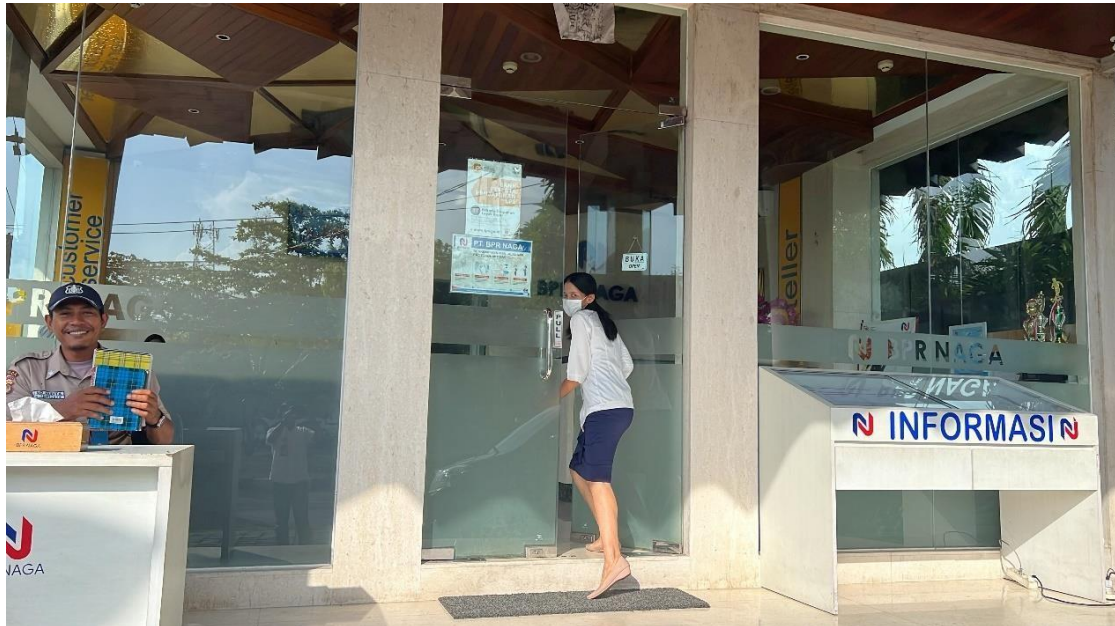
Sumber gambar 1.3 Kondisi pegawai kantor PT BPR NAGA saat penulis melakukan penelitian