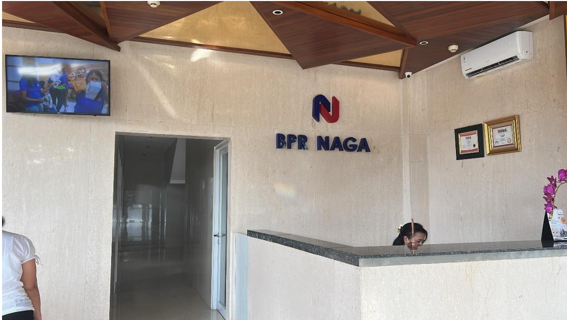
Sumber gambar 1.1 kondisi kantor PT BPR NAGA saat penulis melakukan penelitian