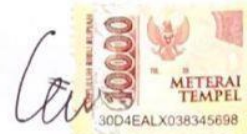
Gregorius Risang Gading Pamungkas

Yogyakarta, 26 / 03 /2024 Saya yang menyatakan,