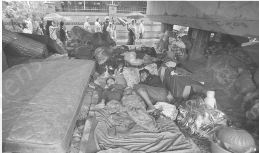
Sumber: Koran Tempo, 18 Januari 2013