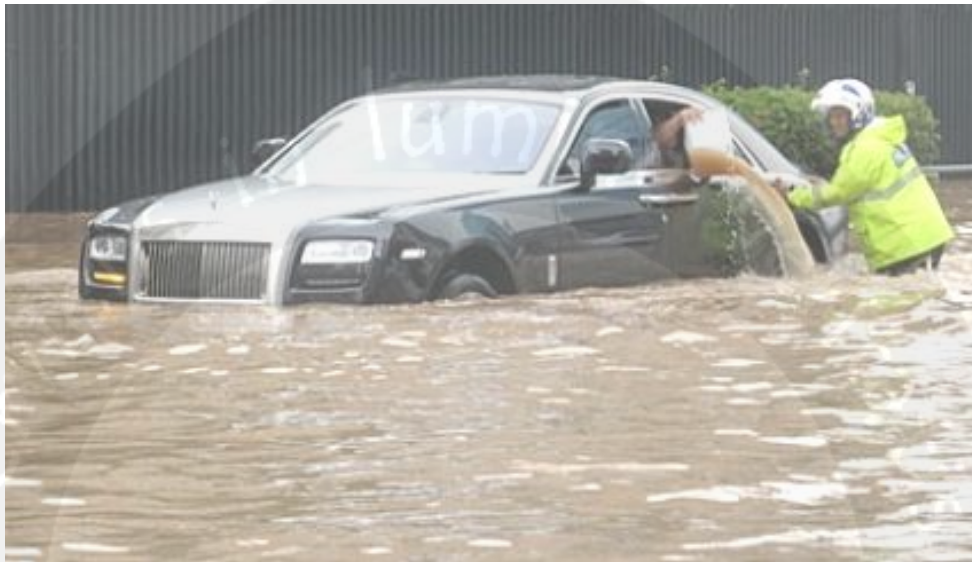
Sumber: Koran Tempo, 18 Januari 2013