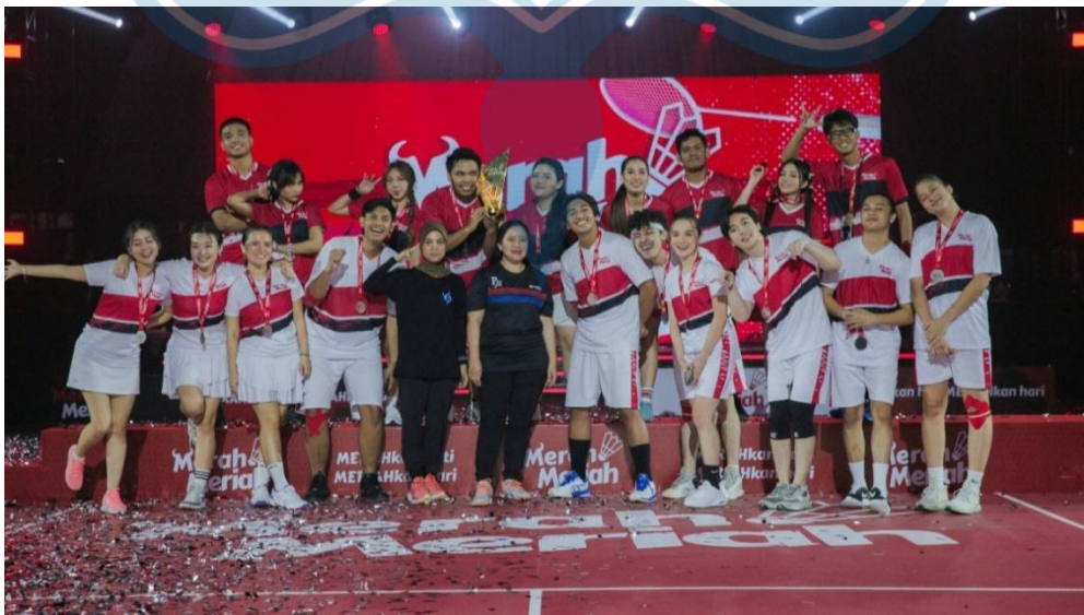
Gambar 2.1 Foto bersama Puan Maharani, Siti Atikoh, Selebriti dan Influencer

Merah Meriah Sportainment adalah ajang pertandingan bulu tangkis yang mempertemukan para artis dan influencer di lapangan. Diselenggarakan di Istora Senayan, Gelora Bung Karno (GBK) pada 14 Januari 2024, acara tersebut berhasil mendatangkan lebih dari 5.000 penonton. Keberhasilan acara tersebut tentu bukan hanya karena trend sportainment , namun karena menawarkan pengalaman berbeda dalam menikmati pertandingan hingga menjadi sarana bagi para pemain untuk mengespresikan keterampilan dan semangat kompetisi (Dahuri, 2024).