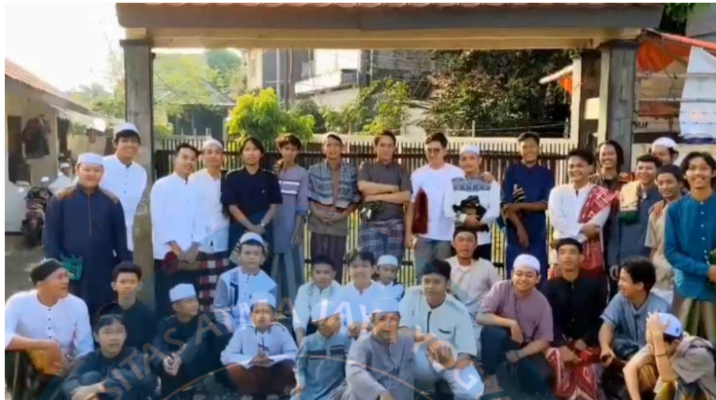
Gambar 4. Pertemuan Saat Libur Lebaran 2024

Pada gambar 4 dapat dilihat bahwa Komunitas Mobile Legends Indonesia sering diadakannya acara bertemu tatap muka oleh komunitas Mobile Legends Indonesia, salah satunya melakukan pertemuan saat libur lebaran 2024. Selain itu, banyak aktivitas yang dilakukan secara rutin, seperti bermain bersama, menonton film di bioskop hingga bertemu untuk mengobrol saja. Biasanya kegiatan ini dilakukan di kota-kota seperti Tangerang, Jakarta Barat, Bogor, dan Jogja, menunjukkan kekuatan dan keaktifan komunitas tersebut. Acara-acara ini mencakup berbagai kegiatan seperti bermain bersama, acara keakraban, menonton film bersama, dan menghadiri acara resmi Mobile Legends Bang Bang di beberapa kota. Pada acara-acara tersebut, seringkali diundang pro player dari berbagai tim untuk memberikan pengalaman dan wawasan tambahan kepada anggota komunitas.