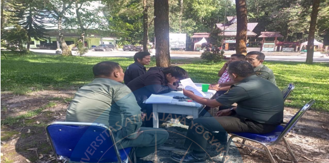
Lampiran 2 wawancara penulis Polisi Kehutanan dan kepala upt Taman Hutan Raya Bukit Barisan