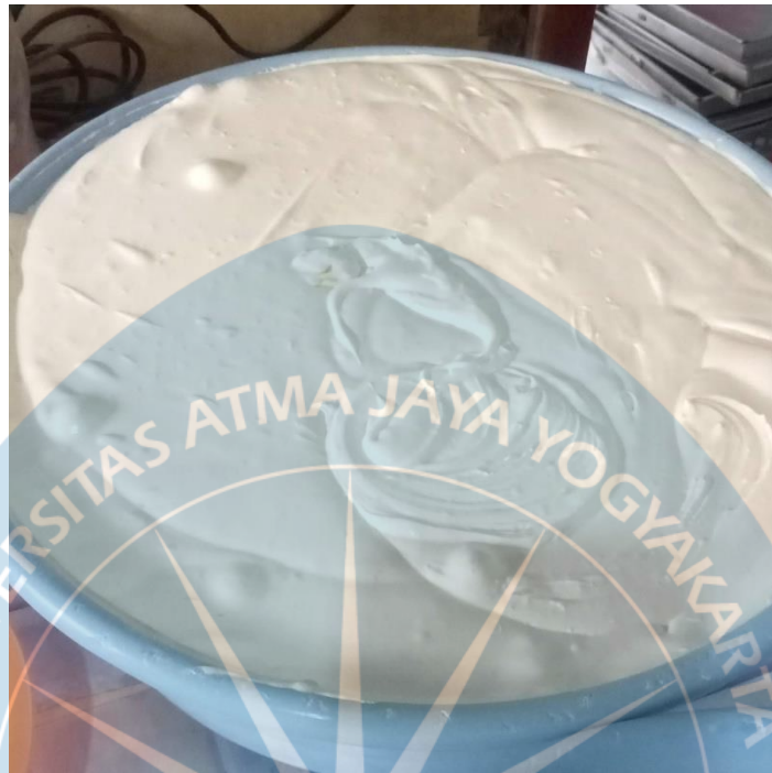
Gambar 1. 1 Adonan mentah