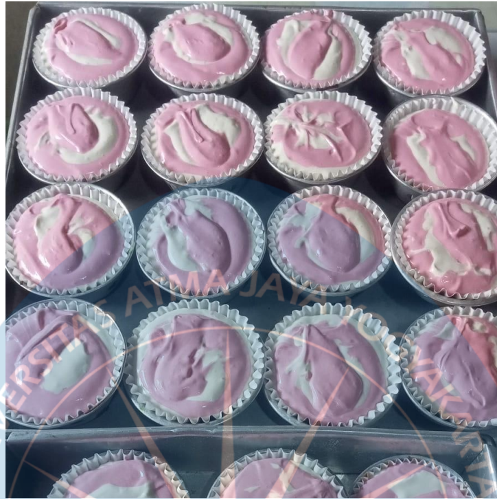
Gambar 1. 3 Adonan yang telah dicetak