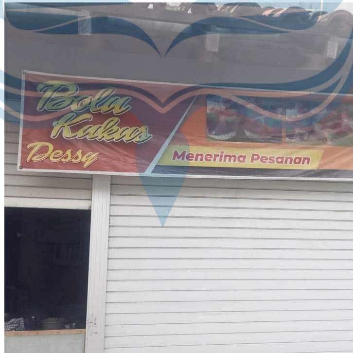
Gambar 1. 8 Tempat Produksi Bolu Kukus