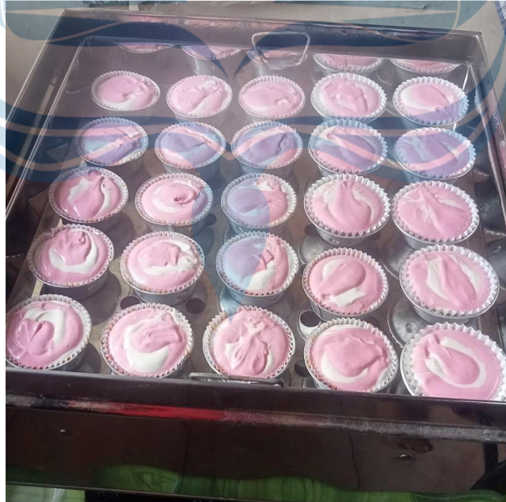
Gambar 1. 4 Adonan siap dikukus