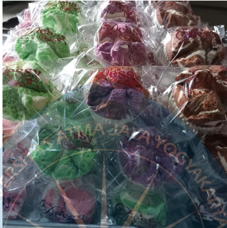
Gambar 1. 7 Bolu kukus siap dijual