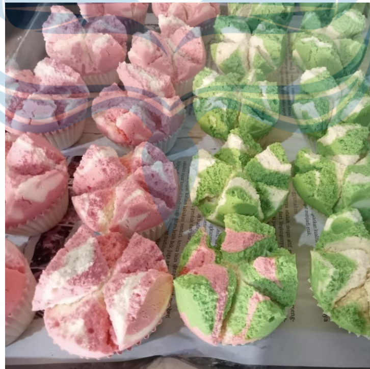
Gambar 1. 6 Bolu kukus