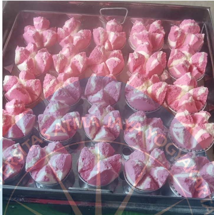
Gambar 1. 5 Adonan setelah dikukus