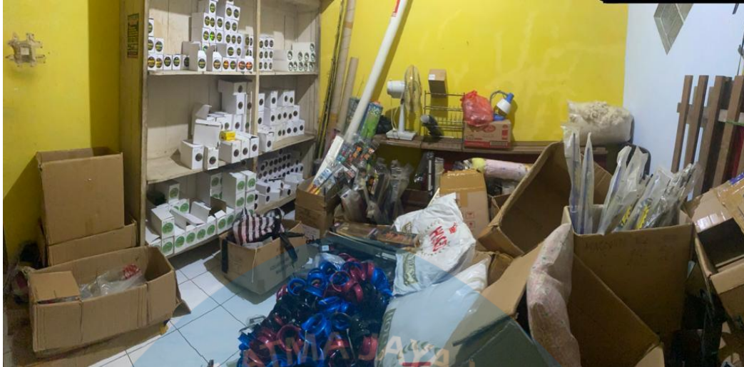
Gambar 1.2. Kondisi Gudang Penyimpanan Persediaan Awal