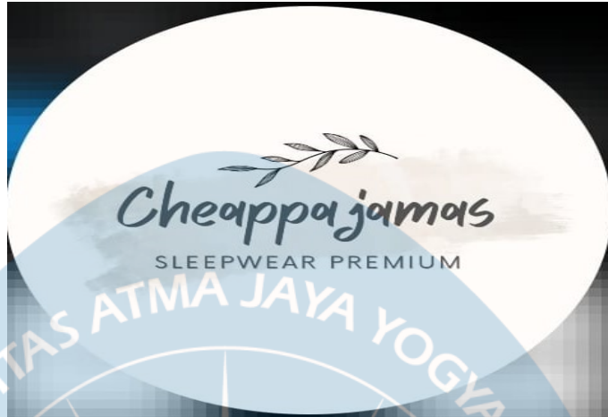
GAMBAR 3 Logo Cheap Pajamas