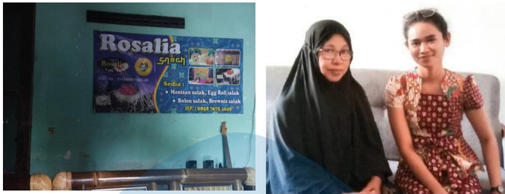
Lampiran 5. Foto Kunjungan Pada tempat usaha