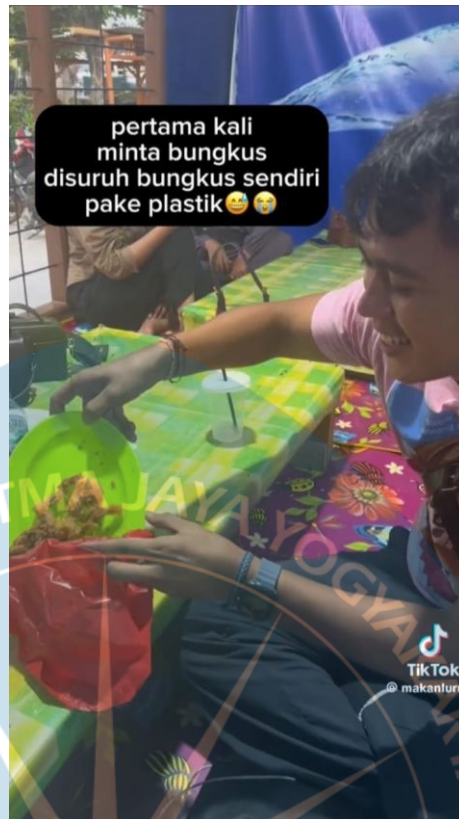
Gambar 2. 3 @makanlurr membungkus makanannya menggunakan kresek

Dalam video tersebut tampak @makanlurr memesan beberapa menu yang tersedia di Rumah Makan Madun Oseng Nyak Kopsah dan @makanlurr juga menyatakan bahwa rasa untuk makanannya enak, Namun, untuk ukuran rumah makan yang sederhana menurut @makanlurr harga yang diberikan cukup mahal. Selain itu, @makanlurr juga cukup terkejut karena saat ada makanan yang tidak habis dan @makanlurr ingin membungkusnya, Ia hanya mendapatkan kantong kresek dan disuruh membungkus sendiri makanannya.