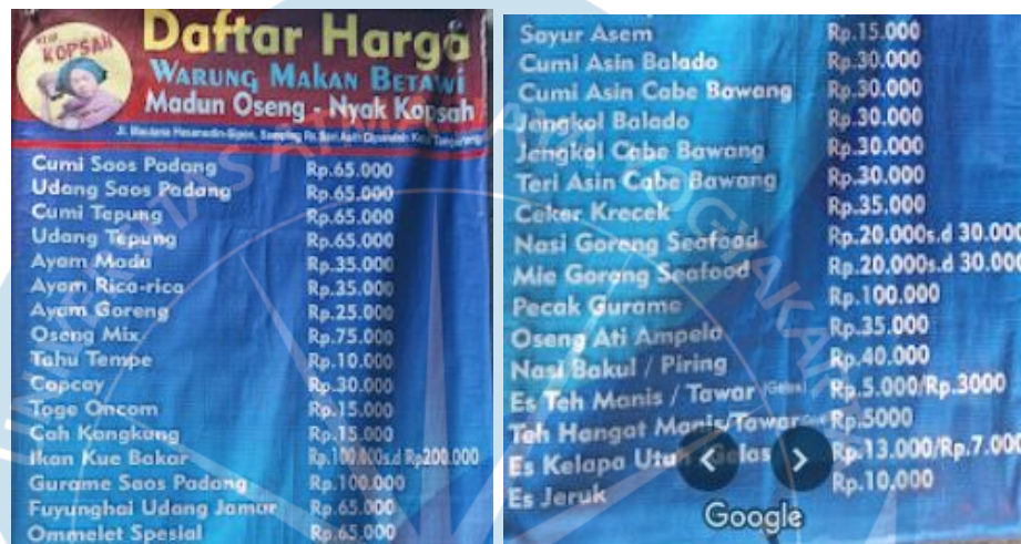
Gambar 2. 5 Daftar Menu Rumah Makan Madun Oseng Nyak Kopsah

Pada awalnya rumah makan ini dimulai dari warung tendaan yang terletak dipinggir jalan dan ini berlangsung selama sepuluh tahun. Seiring berjalannya waktu dan menghadapi jatuh bangun membangun usaha, hingga saat ini yang awalnya berupa warung sekarang sudah berupa rumah makan yang mempekerjakan 12 karyawan.