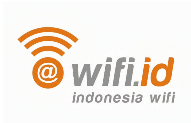
Gambar 3. Logo Indonesia WiFi (WiFi ID)