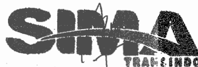
Ready Prabowo Pengelola