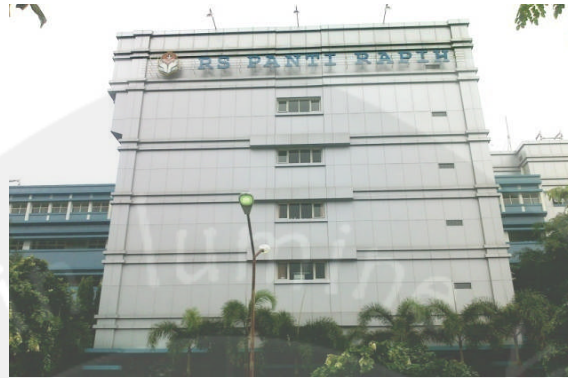
Gambar 1. 2. Rumah Sakit Panti Rapih Yogyakarta