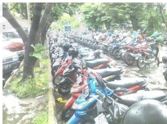
Gambar 1. 4. Ruang Parkir Belakang Rumah Sakit Panti Rapih Yogyakarta