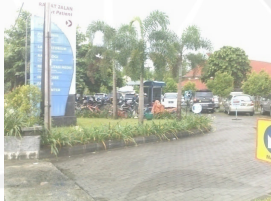
Gambar 1. 3. Ruang Parkir Depan Rumah Sakit Panti Rapih Yogyakarta