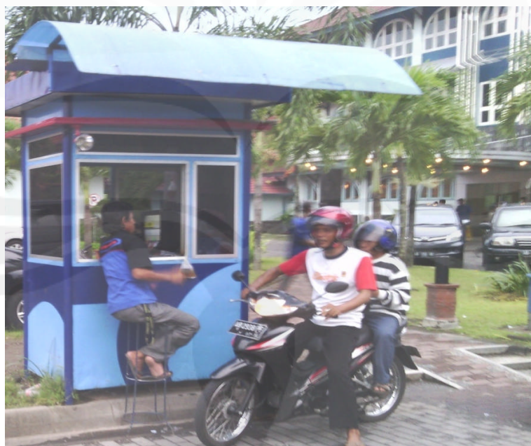
Gambar foto Petugas Karcis/Tiket Keluar Parkir Kendaraan di Rumah Sakit Panti Rapih Yogyakarta