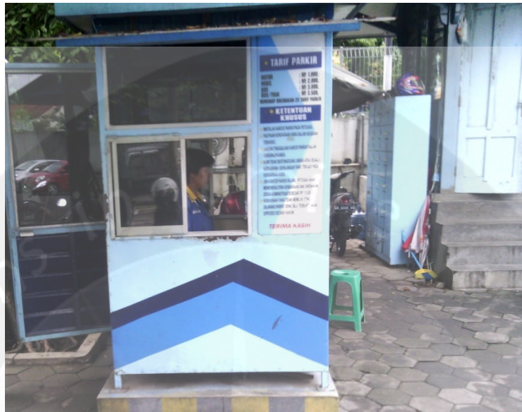
Gambar foto Petugas Karcis/Tiket Masuk Parkir Kendaraan di Rumah Sakit Panti Rapih Yogyakarta