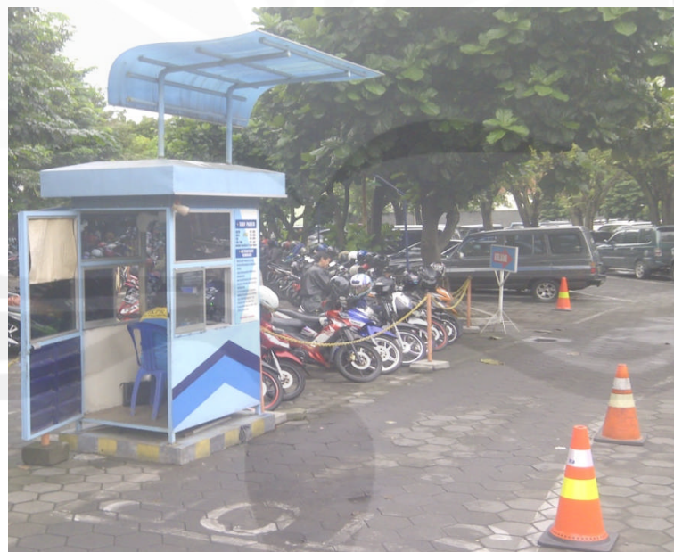
Gambar Foto Tempat Karcis/Tiket Parkir kendaraan di Rumah Sakit Panti Rapih Yogyakarta