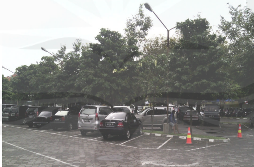
Gambar Foto Keadaan Parkir Mobil Penumpang Sisi Utara di Rumah Sakit Panti Rapih Yogyakarta