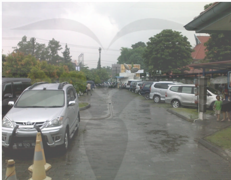
Gambar Foto Keadaan Parkir Mobil Penumpang Sisi Barat di Rumah Sakit Panti Rapih Yogyakarta