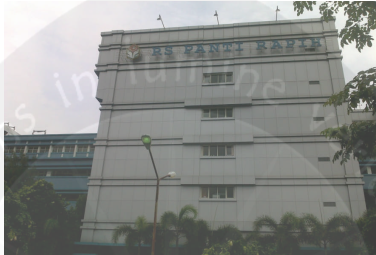
Gambar Foto Rumah Sakit Panti Rapih Yogyakarta Sisi Utara