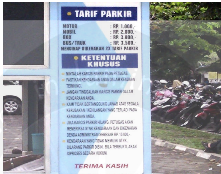
Gambar Foto Tarif Parkir Kendaraan di Rumah Sakit Panti Rapih Yogyakarta