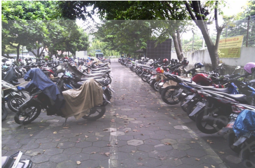
Gambar Foto Keadaan Parkir Sepeda Motor Sisi Utara di Rumah Sakit Panti Rapih Yogyakarta