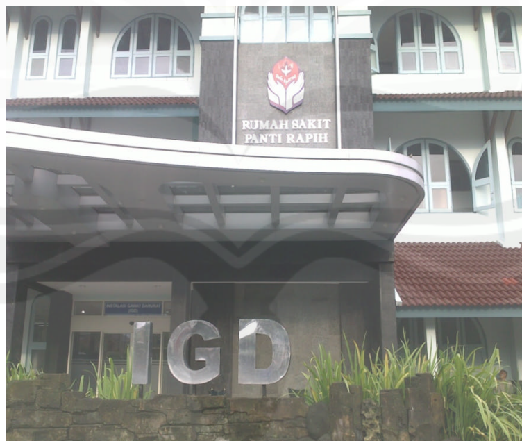
Gambar Foto Rumah Sakit Panti Rapih Yogyakarta Sisi Barat