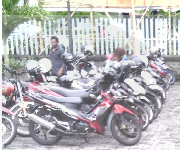
Gambar Foto Keadaan Parkir Sepeda Motor Sisi Barat di Rumah Sakit Panti Rapih Yogyakarta