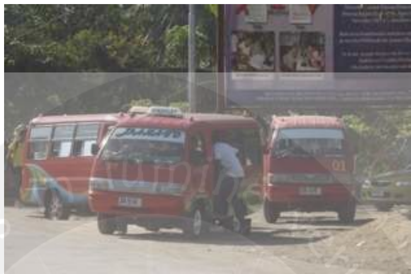
Lampiran 5 Gambar Terminal Angkot