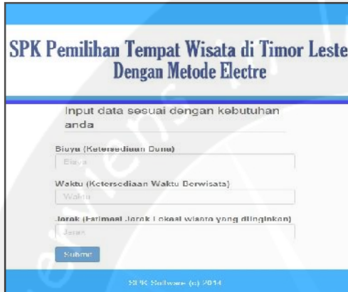
Gambar 2. Halaman Pencarian Informasi dan rekomendasi

Gambar 2 merupakan halaman utama user dimana terdapat fasilitas masukkan biaya, waktu dan jarak. Setelah user member input, sistem akan memproses inputan kriteria tersebut dengan metode ELECTRE.