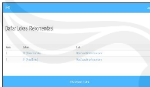
Gambar 3. Halaman hasil dan rekomendasi

Gambar 3 merupakan halaman hasil informasi dan rekomendasi yang diberikan oleh sistem sesuai dengan masukkan yang diberikan user. Pada halaman ini akan ditampilkan nama lokasi wisata yang di rekomendasikan, link yang mengarah ke detail informasi lokasi wisata.