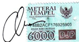
Anditya Y. Angwarmase