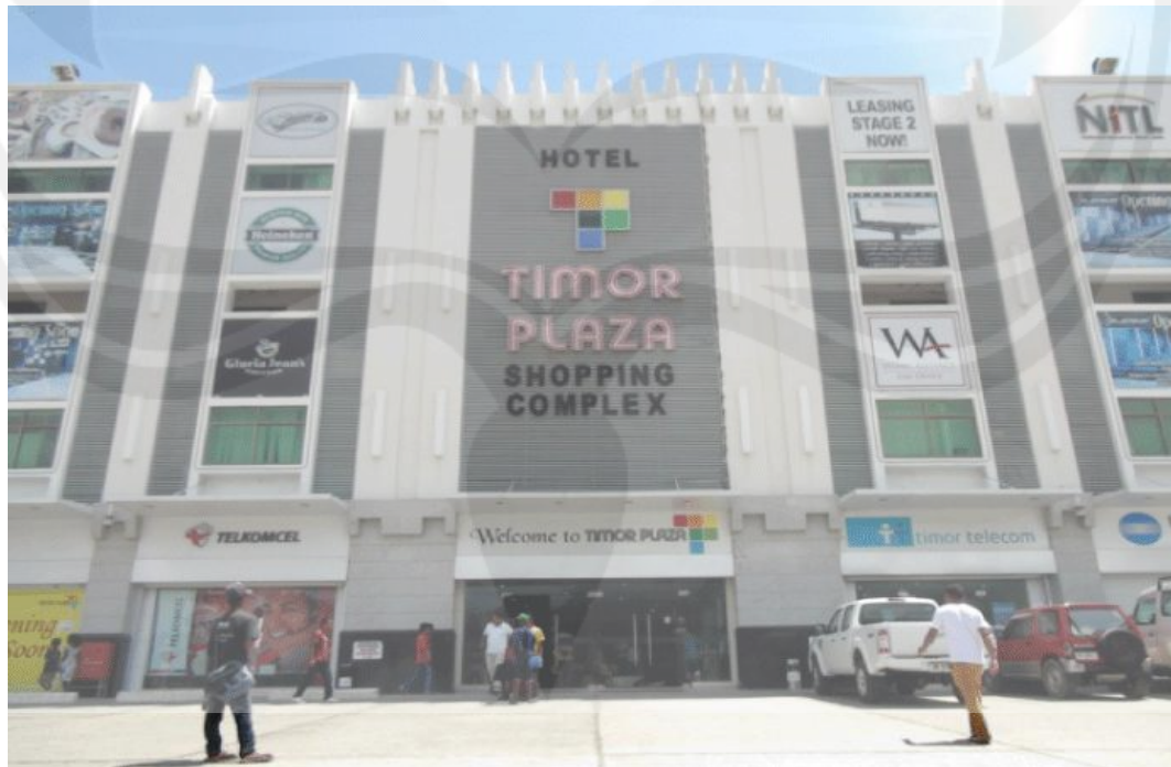
Gambar 1.3 Tampak Depan Timor Plaza Mall