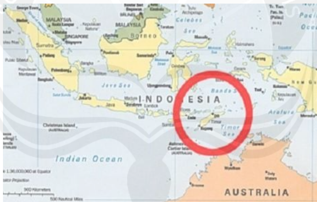
Gambar 1.1 Peta Lokasi Penelitian

Timor Plaza Mall terletak di Jalan Comoro - Nicolau Lobato, Kota Dili - Republica Democratica De Timor Leste terletak (RDTL) di ujung timur dari jajaran Nusa Tenggara atau bagian timur Pulau Timor.