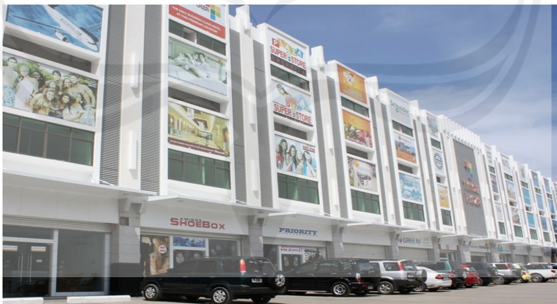
Kondisi Pukul 09 : 00 OTL