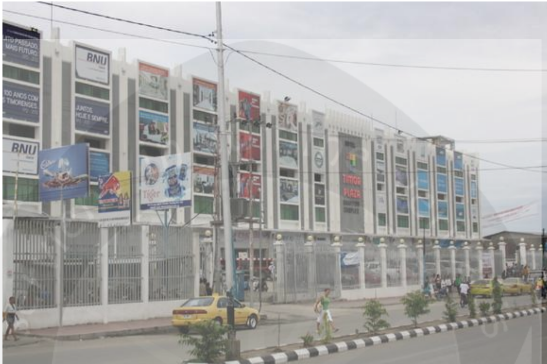
Kondisi Pukul 11 : 00 OTL