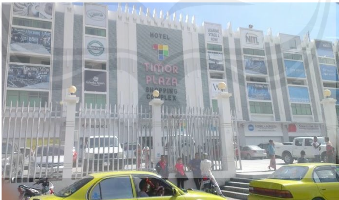
Kondisi Pukul 12 : 00 OTL