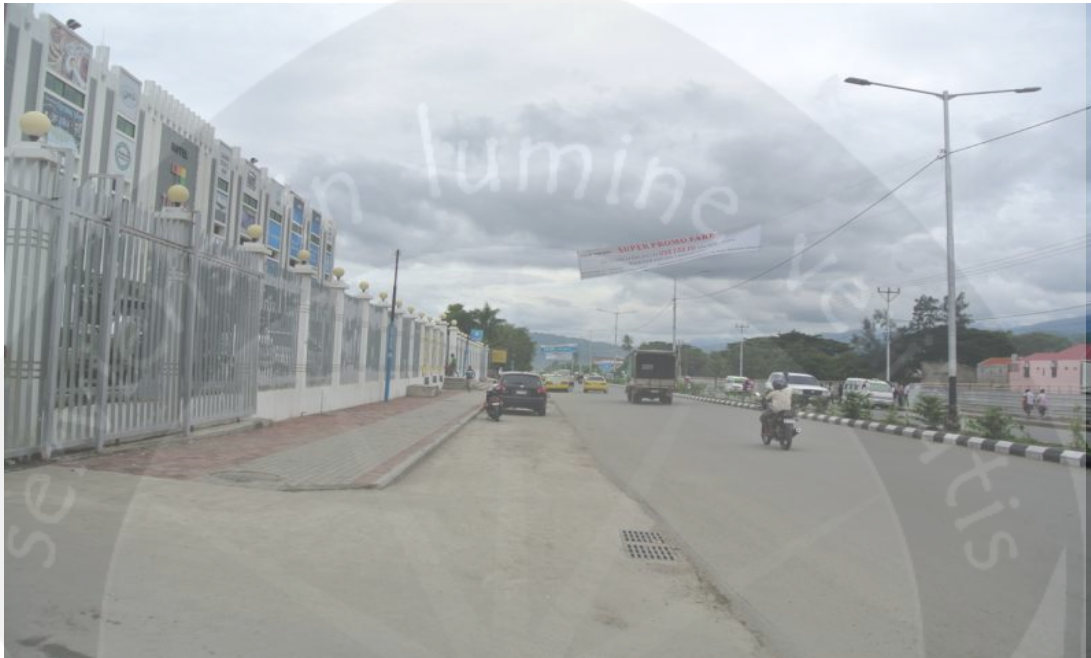
Kondisi Pukul 07 : 00 OTL