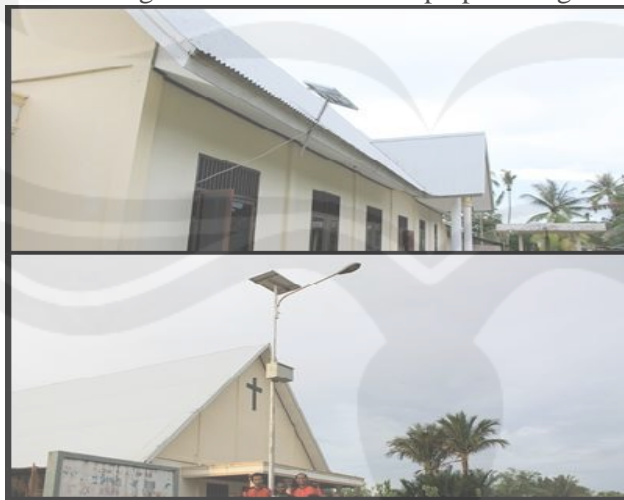
Sumber : PetroChina Internasional (Bermuda ) Ltd