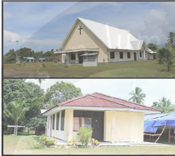
Sumber : PetroChina Internasional (Bermuda ) Ltd