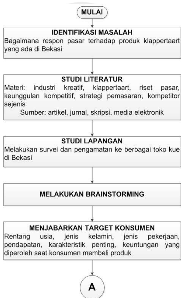
Gambar 3.1. Diagram Alir Penelitian

Metodologi penelitian dalam bentuk diagram alir ( flow chart ) akan ditunjukkan dalam gambar di bawah ini.