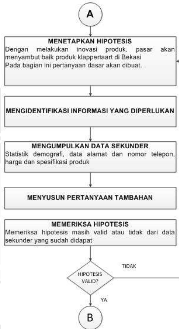
Gambar 3.1. Lanjutan