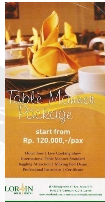
Gambar 9. Leaflet Table Manner Package

Leaflet Table Manner Package merupakan leaflet yang diproduksi pada Bulan Agustus 2013 berisi promo pelatihan table manner dengan tarif Rp 120.000,00 per orang. Pelatihan ini mendapatkan beberapa fasilitas seperti hotel tour, live cooking demo, juggling attraction, making bed demo , dan sertifikat. Pelatihan ini biasanya ditujukan kepada instansi-instansi yang membutuhkan pelatihan table manner seperti akademi perhotelan dan kantor-kantor.