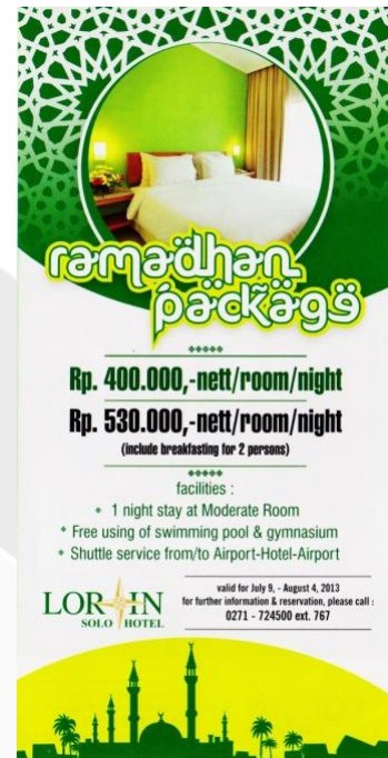
Gambar 7. Leaflet Ramadhan Package (9 Juli – 4 Agustus 2013)

Leaflet Ramadhan Package merupakan leaflet yang dibuat untuk event khusus yaitu Ramadhan. Promo ini berisi informasi mengenai paket menginap bagi 2 orang selama periode 9 Juli – 4 Agustus 2013 dengan fasilitas menginap di moderate room , gratis menggunakan fasilitas kolam renang dan gymnasium, antar jemput bandara-hotel-bandara. Tarif untuk menginap pada periode event ini adalah Rp 400.000,00 tanpa breakfast dan Rp 530.000,00 dengan breakfast .