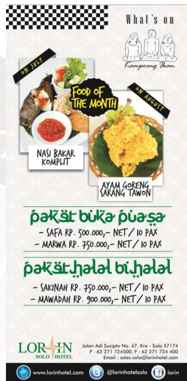
Gambar 4. Leaflet Kampoeng Ikan Restaurant Juli – Agustus 2013

Leaflet Kampoeng Ikan Restaurant merupakan leaflet dwibulanan yang berisi mengenai informasi promo yang ada di restaurant tersebut selama dua bulan ke depan. Pada edisi kali ini, Kampoeng Ikan menawarkan Nasi Bakar Komplit sebagai menu andalan di Bulan Juli dan Ayam Goreng Sarang Tawon sebagai menu andalan di Bulan Agustus, serta paket-paket berkaitan dengan Bulan Ramadhan seperti Paket Buka Puasa dan Paket Halal Bihalal.