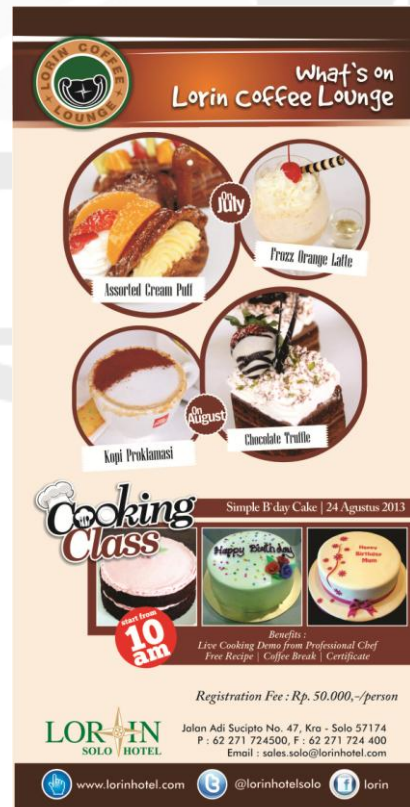
Gambar 6. Leaflet Lorin Coffee Lounge Juli – Agustus 2013

Leaflet LC Lounge merupakan leaflet dwibulanan yang berisi mengenai informasi promo yang ada di lounge tersebut selama dua bulan ke depan. Pada edisi kali ini, LC Lounge menawarkan menu spesial yang hanya bisa dinikmati spesial di Bulan Juli berupa Assorted Cream Puff dan Frozz Orange Latte , sedangkan untuk Bulan Agustus, LC Lounge menyediakan Chocholate Truffle serta Kopi Proklamasi . LC Lounge juga mempromosikan kegiatan Cooking Class "Simple Birthday Cake" .