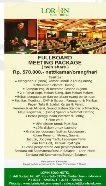
Gambar 10. Leaflet Fullboard Meeting Package

Fullboard Meeting Package merupakan paket untuk meeting sekaligus menginap dengan tarif standar diluar tarif event yaitu Rp 570.000,00 per orang. Paket yang menawarkan fasilitas meeting ini terdiri dari sarapan pagi, coffee break , alat tulis, spanduk selamat datang, dan sebagainya. Selain itu, paket ini juga sudah termasuk menginap satu malam di moderate room .