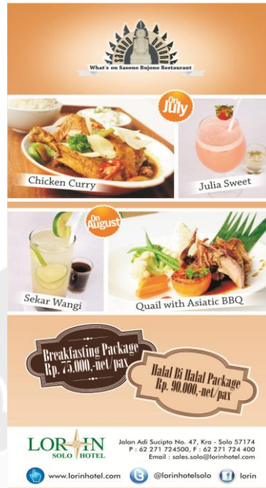
Gambar 5. Leaflet Sasono Bujono Restaurant Juli – Agustus 2013