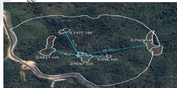
Gambar 3. Skema pengaliran dari sumber mata air Gua Ngguwu menuju ke setiap lahan pertanian di Kawasan Gua Ngguwu.