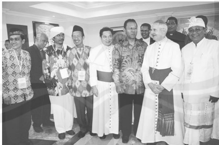
Gambar 1.1. Kerukunan antar umat beragama.

Indonesia adalah bangsa yang merdeka, termasuk dalam menentukan agama apa yang akan dianut dan diyakini oleh masing-masing warganya. Hal tersebut telah diatur dalam UUD tahun 1945 pasal 29 ayat 1 dan 2 yang berbunyi “ Negara berdasar atas Ketuhanan Yang Maha Esa. Negara menjamin kemerdekaan tiap-tiap penduduk untuk memeluk agamanya masing-masing dan untuk beribadat menurut agamanya dan kepercayaannya itu ”. Dengan adanya jaminan oleh negara akan kebebasan beragama bagi setiap warganya, maka tidak heran jika di Indonesia terdapat berbagai agama yang terdiri dari Islam, Kristen, Katolik, Budha, Hindu, dan konghuchu. Keragaman agama tersebut tentunya membutuhkan sebuah wadah untuk melakukan aktivitas keagamaan masing-masing.