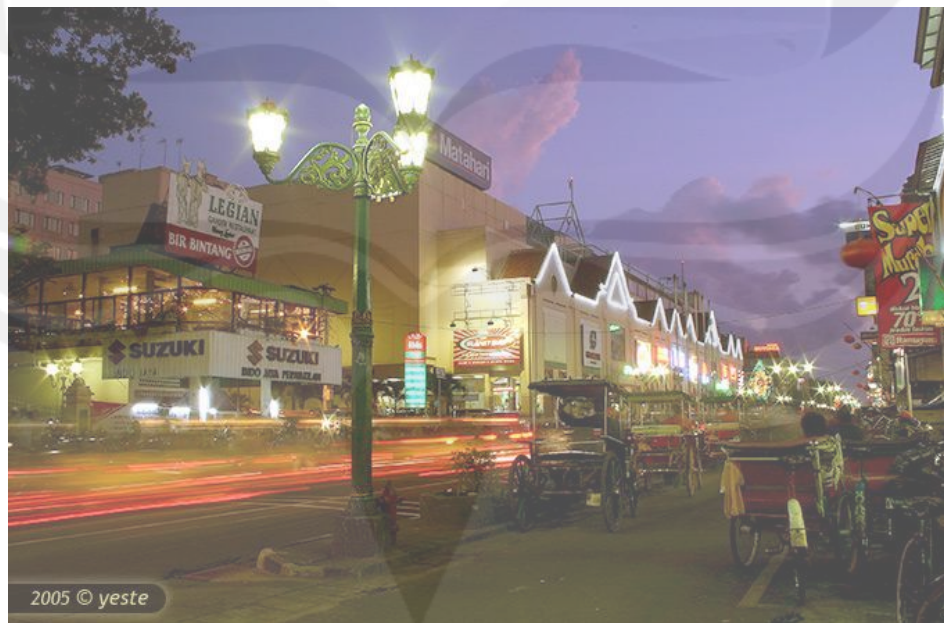
Gambar 1.3. Keramaian malam Malioboro.

Keanekaragaman upacara keagamaan dan budaya dari berbagai agama serta didukung oleh kreativitas seni dan keramahan masyarakat, membuat DIY mampu menciptakan produk-produk budaya dan pariwisata yang menjanjikan. Pada tahun 2010 terdapat 91 desa wisata dengan 51 diantaranya yang layak dikunjungi 1 . Jumlah pengunjung yang meningkat dari tahun ke tahun menunjukkan bahwa Yogyakarta memiliki potensi wisata yang besar dan tidak kalah dengan Bali sebagai tujuan wisata nomor 1 (satu) di Indonesia.