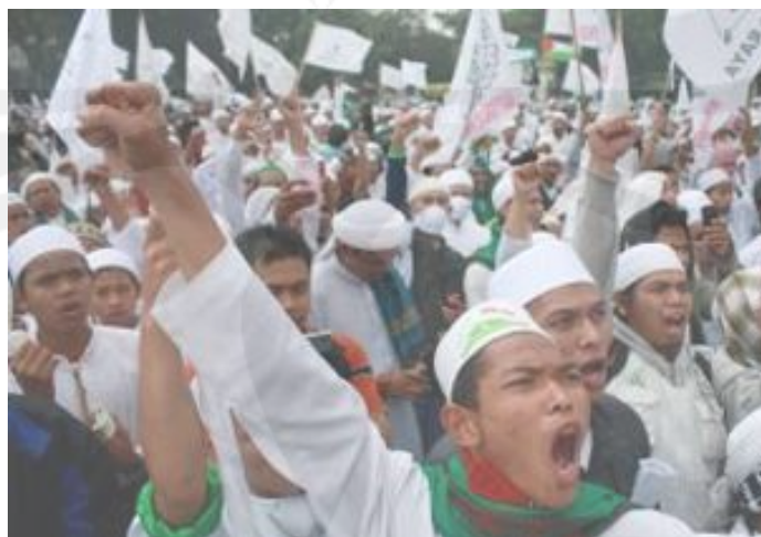
Gambar 1.2. Salah satu aksi berkedok agama yang dilakukan oleh FPI.

Kurangnya kegiatan pendalaman agama dalam keluarga maupun dalam tempat pendidikan seperti sekolah-sekolah, bahkan sampai perguruan tinggi berdampak negatif bagi masyarakat. Ini dibuktikan dengan semakin banyaknya aksi-aksi kekerasan yang terjadi belakangan ini dengan mengatasnamakan agama sebagai kedoknya. Hal itu menjadi satu fenomena yang menyakitkan bagi kita semua. Semboyan bangsa “Bhinneka Tunggal Ika”(walaupun berbeda-beda tetapi tetap satu) nampaknya mulai dilupakan banyak orang. Kenyataan bahwa bangsa ini dibangun lewat keberagaman; etnis, agama, sosial, budaya, ekonomi, dan latar belakang kehidupan lainnya, seolah terlupakan. Maraknya aksi kekerasan tersebut dikuatkan dengan pernyataan K.H. Abdul Rozaq Shofawi selaku Pengasuh Pondok Pesantren Al Muayyad Mangkuyudan, Solo, dalam artikel “Benahi Pendidikan Agama, Cegah Radikalisme, Kekerasan , Terorisme” menyatakan “Gerakan-gerakan radikal semacam itu karena pemahaman agama mereka yang kurang,”.