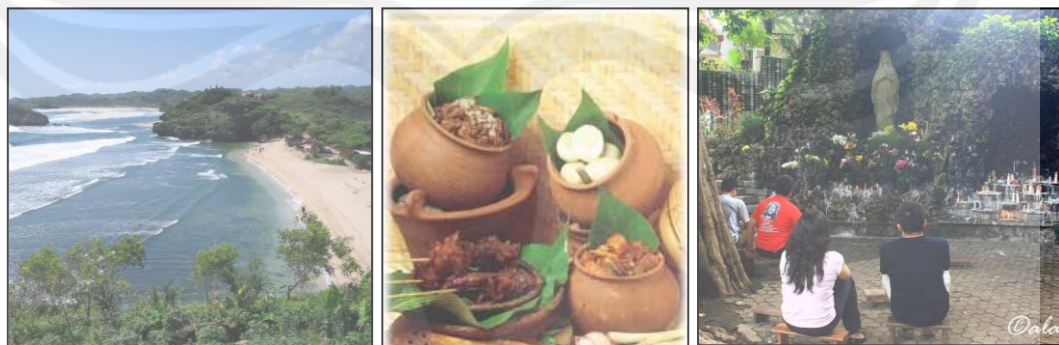
Gambar 1.4. Beberapa contoh potensi wisata di Yogyakarta (wisata pantai, wisata kuliner dan wisata religi). Sumber www.google.co.id 5,maret,2012

Berbagai jenis pariwisata yang menjadi tujuan wisatawan di DIY terdiri dari wisata belanja, candi, goa, gunung, monumen, pantai, budaya, dan wisata religi. Banyaknya ragam wisata yang ditawarkan oleh Yogyakarta berbuah manis, yaitu penghargaan dalam bidang pariwisata berupa ITA ( Indonesian Tourism Award ) pada tahun 2009 sebagai “ Favorite Cities ” dan “ Cities With The Best Service ” pada tahun 2009 dan 2010. 2