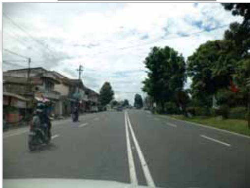
Foto Sebelum Median Ruas B