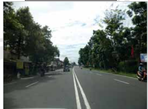
Foto Sebelum Median Ruas B