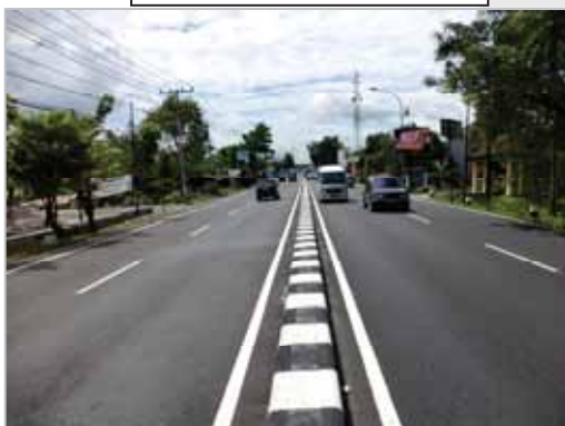
Foto Sesudah Median Ruas B