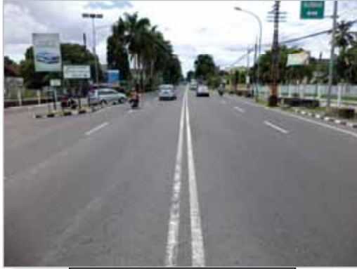
Foto Sebelum Median Ruas A