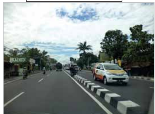
Foto Sesudah Median Ruas B