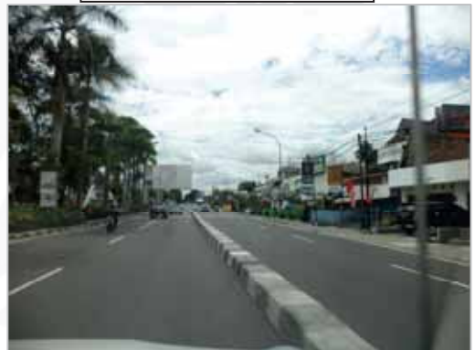
Foto Sesudah Median Ruas A