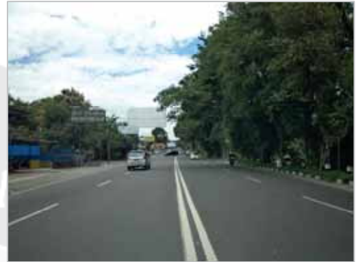
Foto Sebelum Median Ruas A