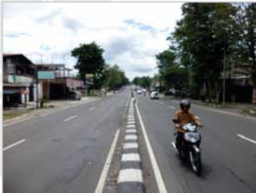
Foto Sesudah Median Ruas A