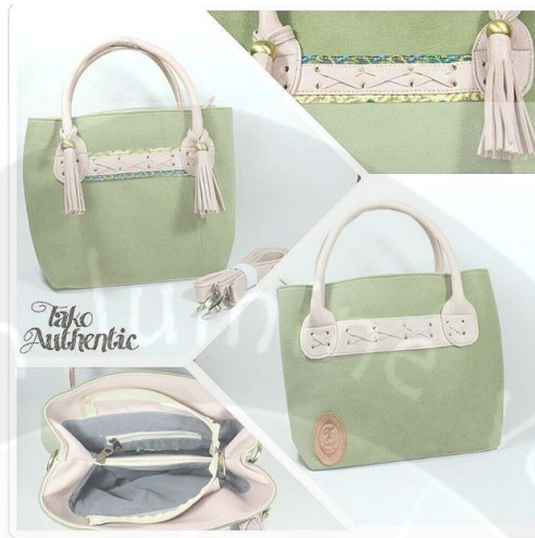
Gambar 12 Foto Tas Handmade Takofeitodmeao Dalam Bentuk Collage