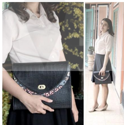
Gambar 8 OOTD Konsumen Memakai Tas Handmade Takofeitodemaio