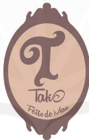
Gambar 9 Logo Takofeitodemaο

Logo Takofeitodemaο seperti gambar 9 berikut ini: