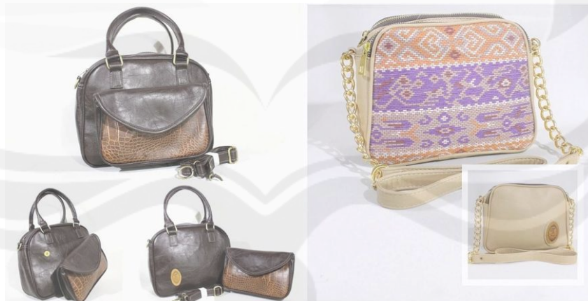
Gambar 10 Contoh Tas Handmade Takofeitodema

Ide awal pada saat mengembangkan tas handmade karena biaya produksi yang tidak terlalu tinggi sehingga tidak membutuhkan modal yang besar. Konsep awal tas handmade yaitu konsumen bisa custom (desain model sesuai keinginan konsumen) namun setelah berkembang dan konsumen semakin bertambah banyak maka desain model tas handmade yang dipasarkan adalah desain model yang telah didesain oleh owner Takofeitodema (Wawancara owner Takofeitodema, 21/09/15). Contoh desain model tas handmade yang didesain oleh owner Takofeitodema seperti terlihat pada gambar 10 di bawah ini.