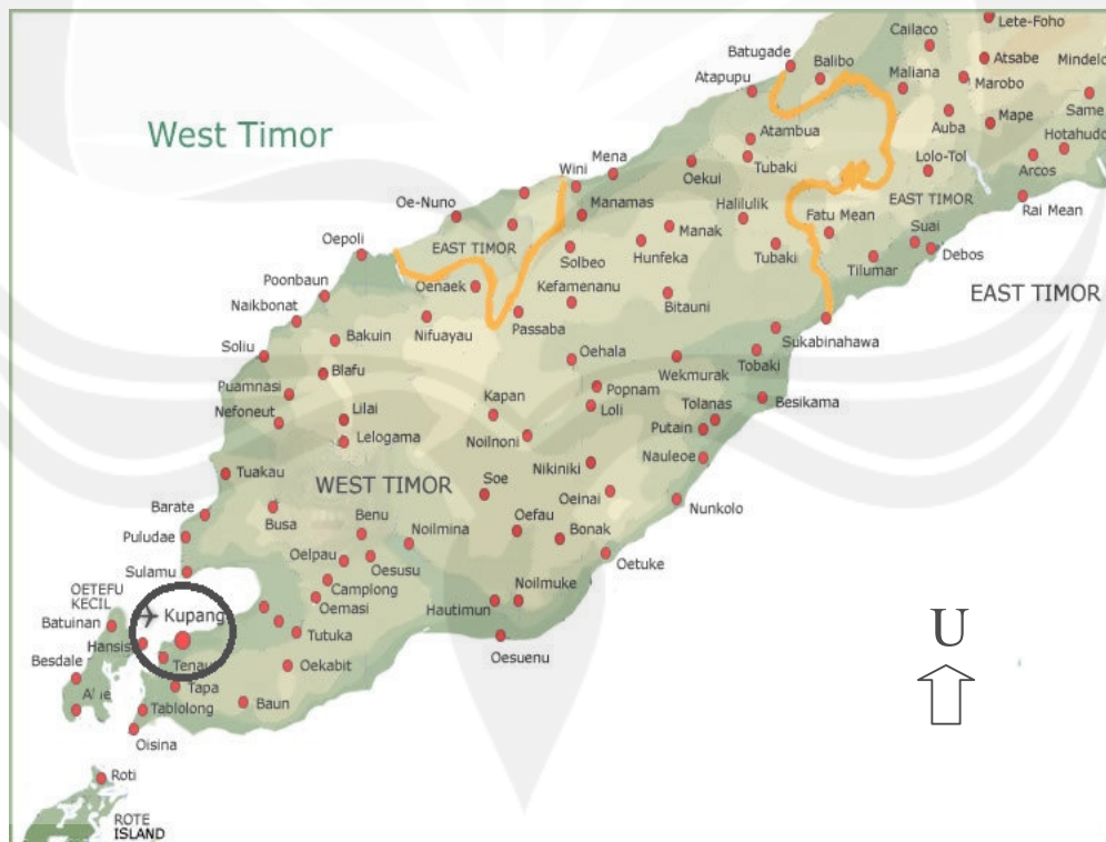
Gambar 1.1. Gambar Peta Pulau Timor

Kota Kupang merupakan ibukota dari Propinsi Nusa Tenggara Timur ( Lihat Gambar 1.1.). Wilayah Propinsi Nusa Tenggara Timur meliputi daratan dan juga perairan. Kota Kupang memiliki luas 229,97 Km 2 . Dengan jumlah penduduk 257.662 jiwa yang tersebar di 4 kecamatan, dan 45 kelurahan. ( Lihat Gambar 1.1.)