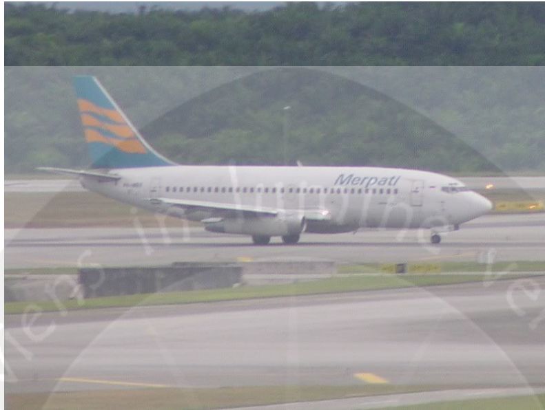
Gambar 1.5. Runway Bandar Udara El Tari Kupang