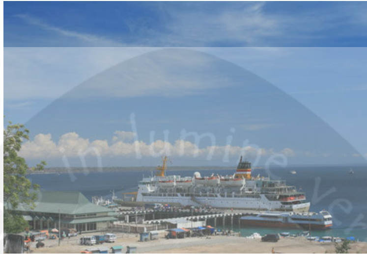
Gambar 1.4. Transportasi Laut di Kupang

Saat ini Bandar udara El Tari Kupang melayani kedatangan pesawat reguler dari Bandar Udara Bali, Surabaya, Jakarta, dan Bandar Udara kecil yang ada di daerah Provinsi Nusa Tenggara timur. Jenis pesawat terbesar yang dilayani Bandar udara El Tari adalah jenis Boeing 737 dan Boeing 734. Bandar udara El Tari Kupang merupakan salah satu penunjang dalam pengembangan daerah Kota Kupang.