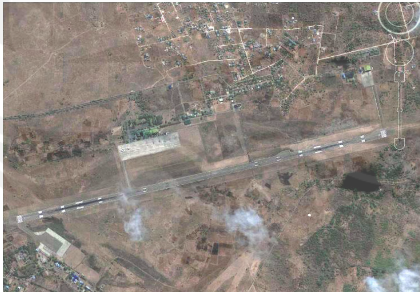
Gambar 1.6. Bandar Udara El Tari Kupang