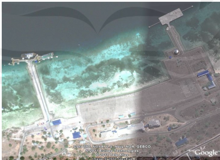
Gambar 1.3. Pelabuhan Laut di Kupang

dan hutan yang harus dilewati dari Kupang ke luar kota Kupang misalnya ke Kabupaten Soe. Sehingga transportasi yang praktis dapat digunakan secara optimal yaitu melalui laut dan udara. Dengan adanya pelabuhan laut dan bandar udara, Kota Kupang menjadi pintu masuk yang strategis ke Negara Timor Leste dan Australia. Oleh karena itu keberadaan bandar udara El Tari di Kota Kupang Propinsi Nusa Tenggara Timur, mempunyai peranan yang sangat penting guna menunjang arus lalu lintas udara antar Negara, Propinsi maupun antar Kabupaten yang ada di Propinsi Nusa Tenggara Timur.. Bandar udara El Tari sendiri mempunyai geometri bandara yang cukup dan lahan yang cukup memadai untuk pesawat berbadan besar.