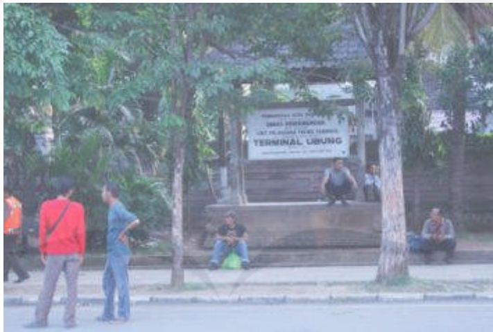
Gambar 1.7 Papan Nama Terminal Ubung