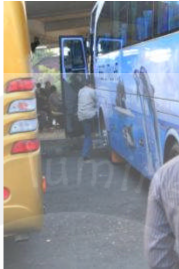
Gambar 1.3 Aktivitas Naik Turun Penumpang