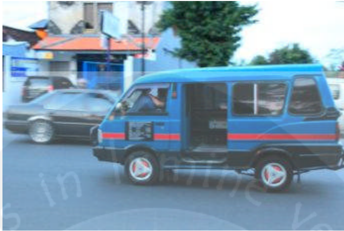
Gambar 1.6 Angkutan Kota yang Sedang Beroperasi