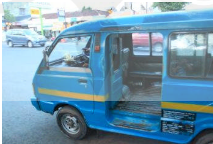
Gambar 1.5 Angkutan Kota yang Sedang Beroperasi