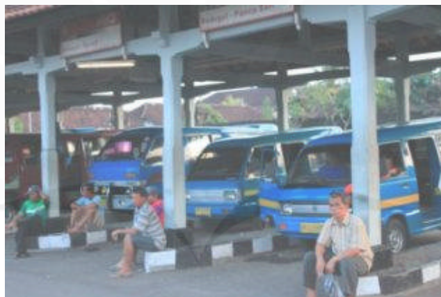
Gambar 1.4 Suasana di Terminal Angkutan Kota