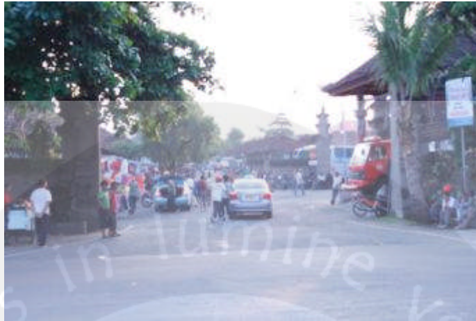
Gambar 1.9 Pintu Masuk Terminal