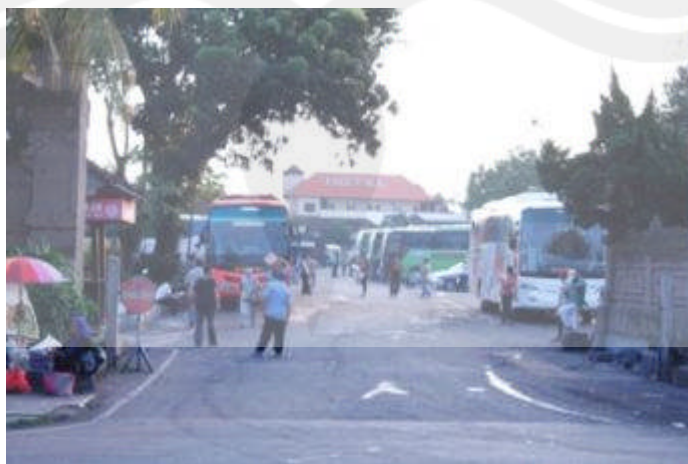
Gambar 1.8 Pintu Masuk Terminal