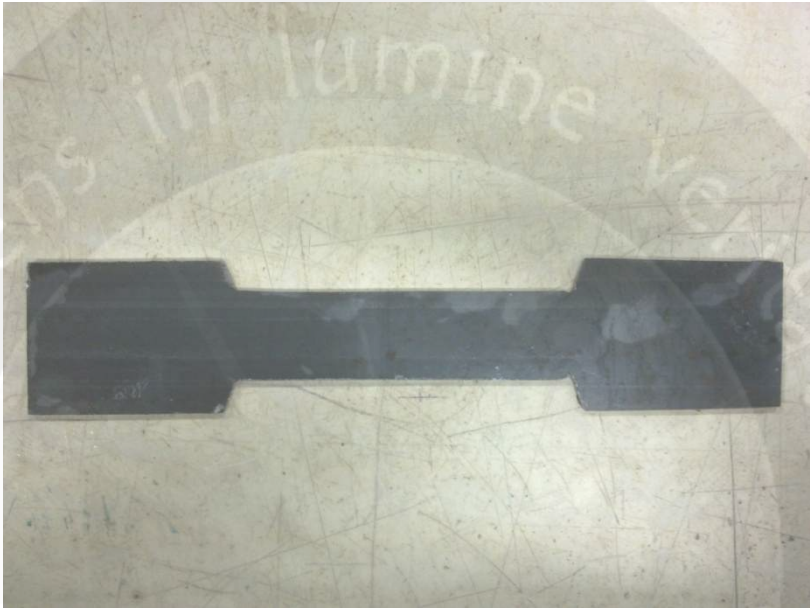
Sampel Baja Profil C Sebelum Diuji