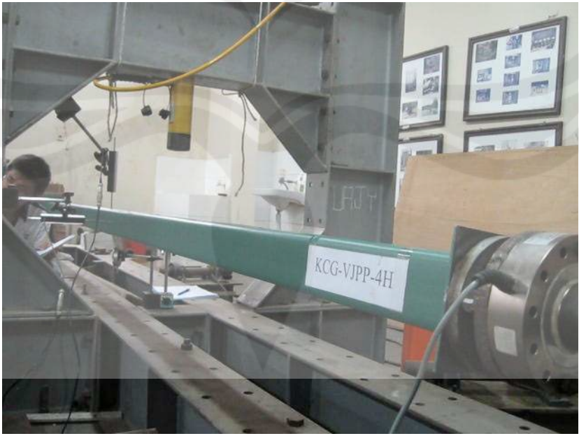
Pengujian Kolom Baja Profil C Gabungan dengan Jarak Pelat pengaku 4H (KCG-VJPP-4H)