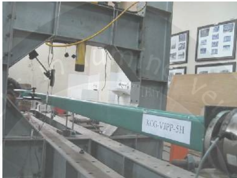
Pengujian Kolom Baja Profil C Gabungan dengan Jarak Pelat pengaku 5H (KCG-VJPP-5H)