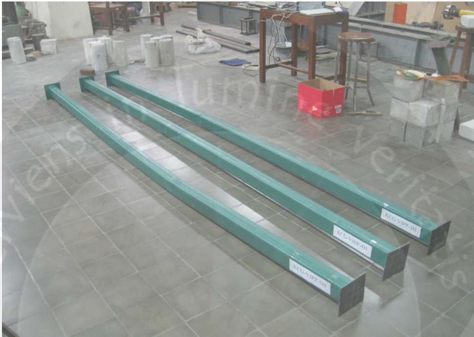
Kolom Baja Profil C Gabungan Setelah Pengujian