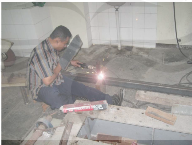
Proses Pengelasan Kolom Baja Profil C Gabungan