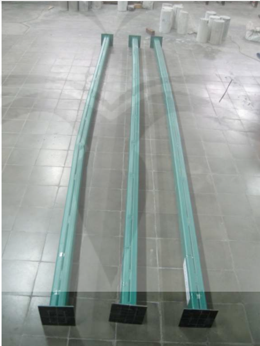
Kolom Baja Profil C Gabungan Setelah Pengujian (dari kiri KCG-VJPP-5H, KCG-VJPP-4H, KCG-VJPP-3H)