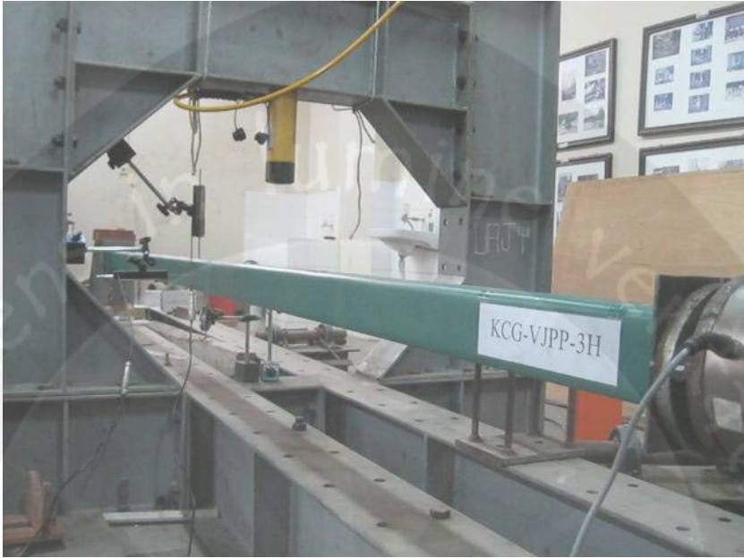
Pengujian Kolom Baja Profil C Gabungan dengan Jarak Pelat pengaku 3H (KCG-VJPP-3H)