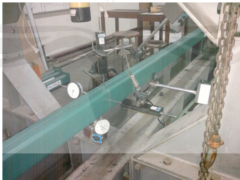
Posisi Pemasangan Dial pada Pengujian Kolom Baja Profil C Gabungan