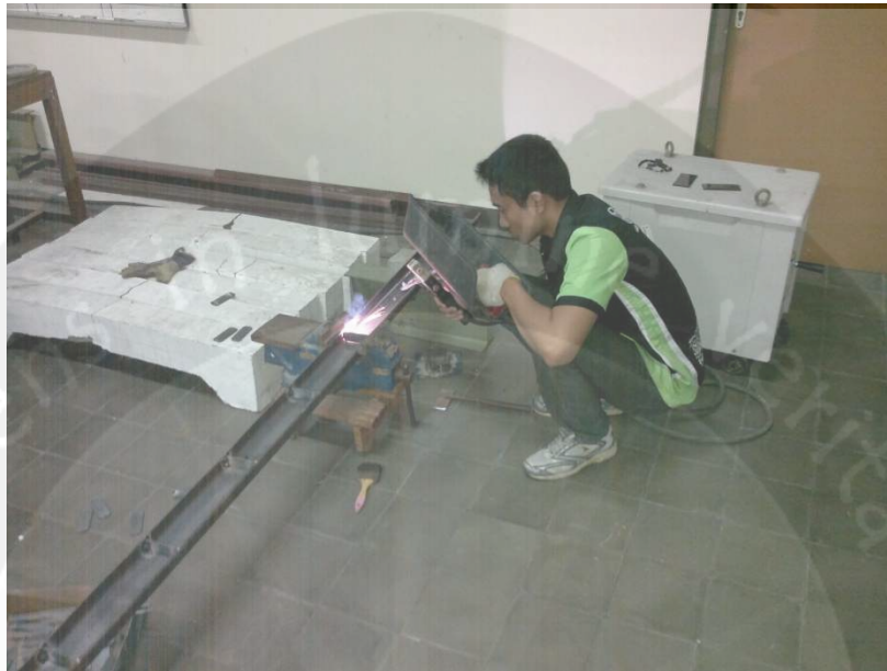
Proses Pengelasan Pelat Pengaku