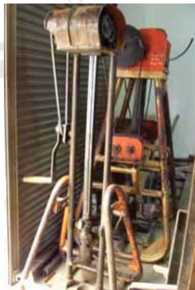
Gambar 2.2. Alat uji Cone Penetration Test

Percobaan Sondir atau Cone Penetration Test (CPT) adalah suatu pengujian tanah yang cukup banyak digunakan di Indonesia. Metode pengujian ini dikembangkan oleh para insinyur Belanda dan digunakan pertama kali tahun 1935. Bagian utama alat ini adalah sebuah kerucut terbalik atau konus yang terbuat dari logam dengan ujung bersudut 60^{\circ} luas dasar 10 \text{ cm}^2 . Prinsip kerjanya adalah alat ini didorong masuk ke dalam tanah dengan kecepatan konstan, gaya perlawanan tanah terhadap gerakan konus dicatat pada interval kedalaman tertentu. Nilai tahanan konus ( q_c ) sama dengan gaya perlawanan dibagi dengan luas dasar konus ( 10 \text{ cm}^2 ). Dari pengujian akan didapat profil nilai tahanan konus q_c terhadap kedalaman. Data ini sangat berguna untuk menentukan pelapisan tanah, dan kompresibilitas, kedalaman tanah untuk mendukung pondasi.